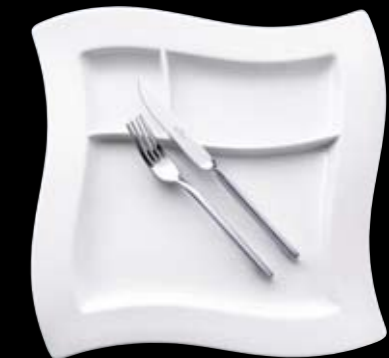
Cutlery NEWWAVE Steak fork · OCR-Nr. 12-6338-0050 Steak knife MB · OCR-Nr. 12-6338-0545