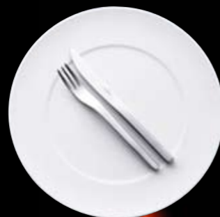
Cutlery GOURMET STEAK L Steak fork · OCR-Nr. 12-6386-0538 Steak knife HH · OCR-Nr. 12-6386-0540