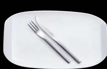
Cutlery GOURMET STEAK XL Steak fork · OCR-Nr. 12-6386-0539 Steak knife HH · OCR-Nr. 12-6386-0541

Bij een perfecte steak hoort een perfect mes: handzaam, uitgebalanceerd, voorzien van spits lemmet en speciale kartelrand. Villeroy & Boch biedt dergelijke messen aan. Een specialiteit in 5 verschillende designuitvoeringen. En voor de perfecte uistraling doen we meteen een suggestie erbij voor passend porselein.