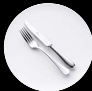
Cutlery COUPOLE Steak fork · OCR-Nr. 16-6248-0050 Steak knife HH · OCR-Nr. 16-6248-0540