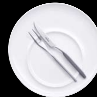
Cutlery MARCHESI Steak fork · OCR-Nr. 12-6354-0538 Steak knife MB · OCR-Nr. 12-6354-0545