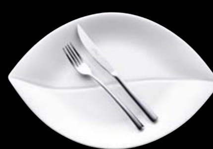
Cutlery PIEMONTE Steak fork · OCR-Nr. 12-6264-0050 Steak knife MB · OCR-Nr. 12-6264-0065